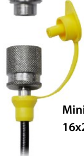
Minimes-Schlauch 16x2 (800 mm)

Aktionspreis: CHF 683.-/Stk. (exkl. MwSt.)